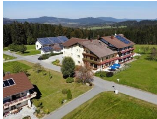
Stellplatz am Hotel Märchenwald

https://www.bayerischer-wald.de/attraktion/knaus-campingpark-lackenhaeuser-ba1934c66d