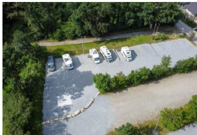
Wohnmobilstellplatz in Waldkirchen

https://www.bayerischer-wald.de/attraktion/stellplatz-am-hotel-maerchenwald-17ffffcb4d