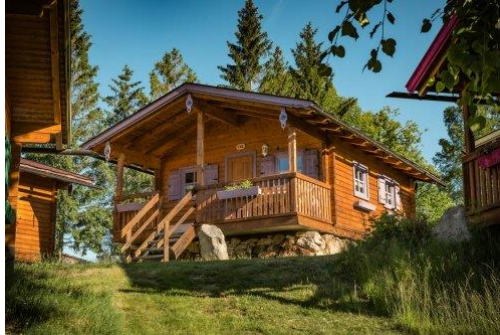
KNAUS Campingpark Lackenhäuser****

https://www.bayerischer-wald.de/attraktion/knaus-campingpark-lackenhaeuser-ba1934c66d