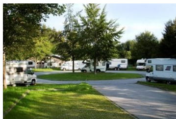
Wohnmobilstellplatz in Freyung-Solla

https://www.bayerischer-wald.de/attraktion/wohnmobilstellplaetze-in-waldkirchen-8e153a52a4